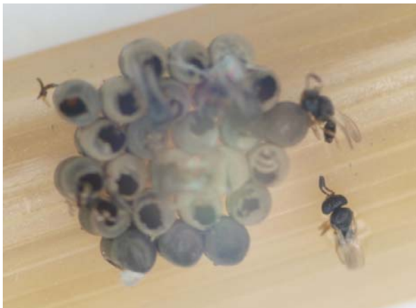
ตัวเต็มวัยแตนเบียน Psix sp.

แตนเบียน Psix sp. ตัวเต็มวัยมีขนาดยาวประมาณ 0.8 มิลลิเมตร หนวดยาวมีสีน้ำตาล โคนหนวดสั้นกว่า หนวดปล้องแรกจะยาว พื้นที่ระหว่างตากว่าง ตาสีน้ำตาล หัว ออก และท้องสีน้ำตาลหรือสีน้ำตาลแก่ หัวและอกมีขนาดกว้างใกล้เคียงกัน อกใหญ่ ส่วนท้องเล็กลง ปีกใส ไม่มีเส้นปีก มีขนสั้นๆ ทั่วปีกหน้า สติกมา (stigma) ยาว ขอบปีกหน้ามีขนยื่นออกไป ปีกยาวพอๆ กับส่วนท้อง ขาทั้ง 3 คู่มีสีน้ำตาลอ่อน เป็นแตนเบียนทำลายไข่แมลงหว่า ไข่ที่ถูกแตนเบียนทำลายจะมีสีดำ บางครั้งพบไข่แมลงหว่า เกือบทั้งกลุ่มถูกแตนเบียนนี้ทำลาย โดยแตนเบียนเจริญเติบโตภายในไข่ เมื่อเป็นตัวเต็มวัยก็จะเจาะผนังด้านบนของไข่แมลงหว่าออกมา