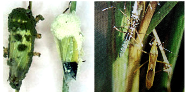
เข็รา M. anisopliae var anisopliae Tulloch. ทำลายเพลี้ยจักจั่นและแมลงสิง