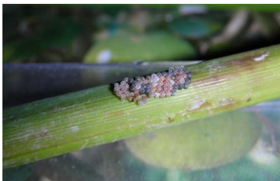
ไข่แมลงหว่าที่ถูกแตนเบียนทำลาย